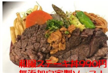
和風ステーキ丼990円 無添加自家製ソース!