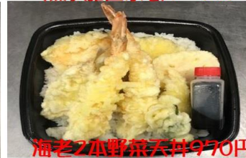
海老2本野菜天丼970円 ほんのり胡麻香る