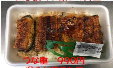
うな重 990円 柔らか焼きたて