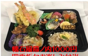
懐石風幕ノ内1000円 四季折々お楽しみ弁当