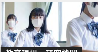
教育現場・研究機関

お客様訪問がある接客クルーやどうしても出社せざるを得ない職場でも、安心して働けることを目指します。