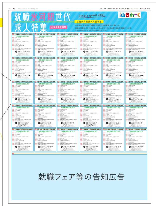
2021年 掲載イメージ ▶

【1社の掲載サイズ】縦62.2mm × 横61mm ※掲載規定(文字サイズ、内容等)がありますのでご了承ください。