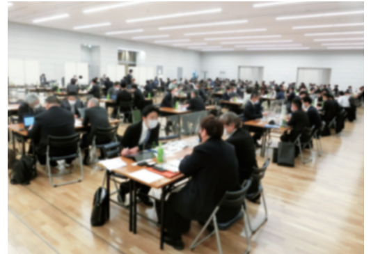
▲商談会当日の様子