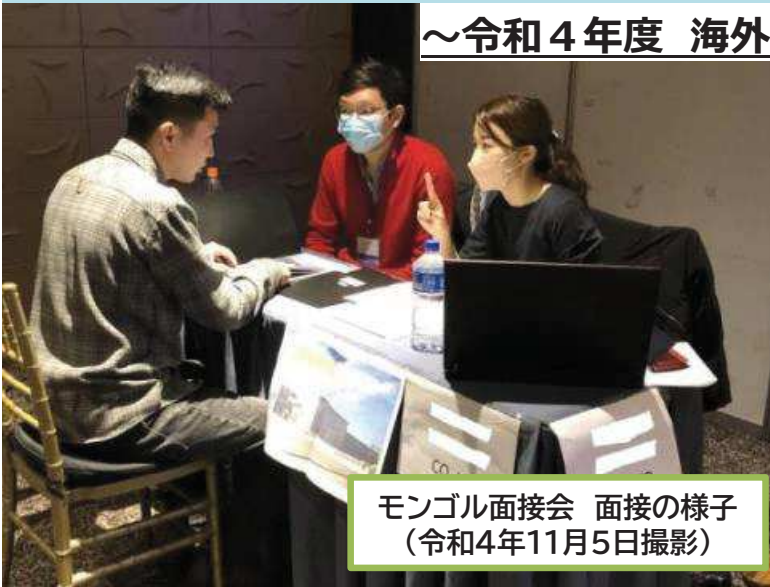
モンゴル面接会 面接の様子 (令和4年11月5日撮影)