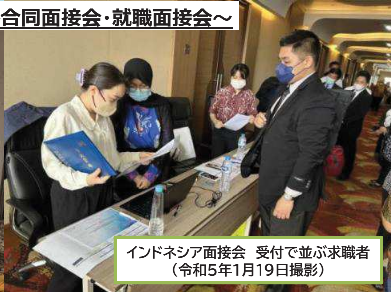
インドネシア面接会 受付で並ぶ求職者 (令和5年1月19日撮影)