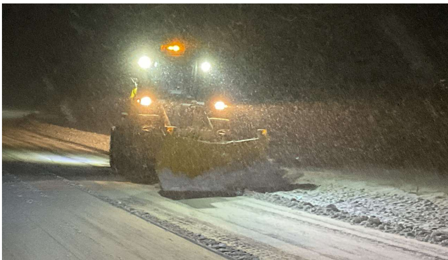
(令和7年3月 国道139号山梨県南都留郡鳴沢村)