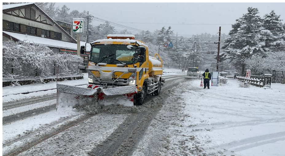
(令和7年2月 国道138号 山梨県南都留郡山中湖村)