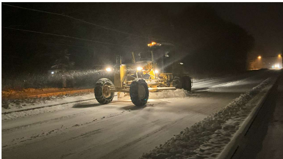
(令和7年3月 国道139号 山梨県南都留郡鳴沢村)