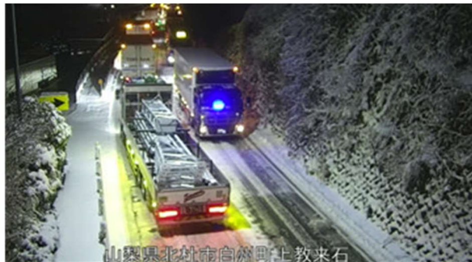
(令和7年3月 国道20号 山梨県北杜市)