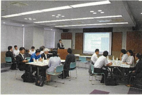
ワークショップ風景(イメージ)